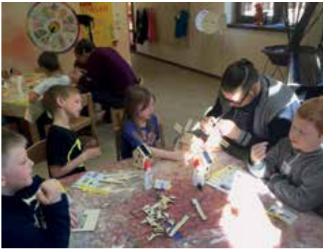
Kath. Kita Merchweiler